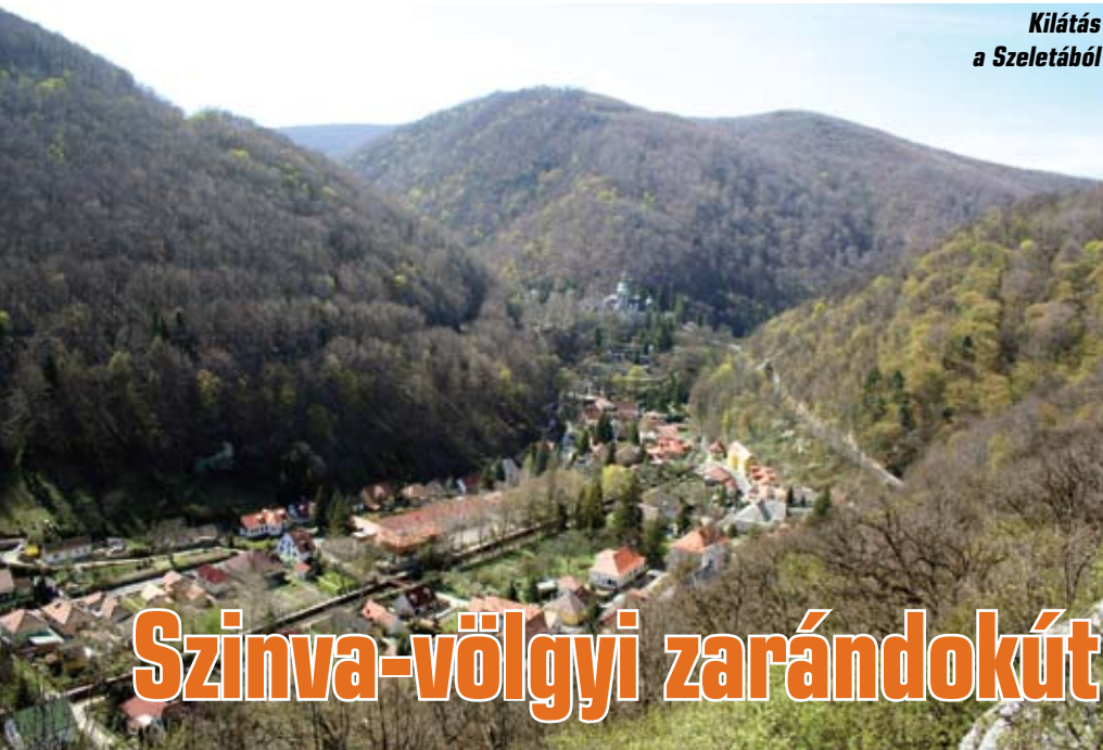
Kilátás a Szeletából