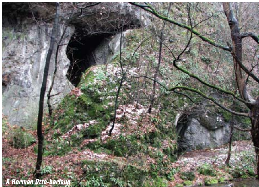
A Herman Ottó-barlang