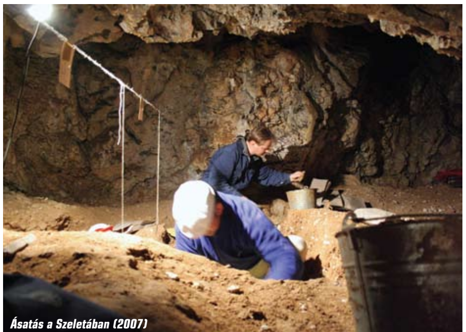
Ásatás a Szeletában (2007)