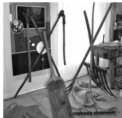
Cséphadarók, szórolapát, gereblye és favilla a kiállításban (Borsod vm.)

Az aratás végeztével a nagy gazdaságokban, uradalmakban felvonulások aratóünnepet tartottak. Búzakarászokból, szalmából, virágokból aratókoszorút és szalmadíszeket fontak, a szerszámokat kifestve, felpántlikázva vitték magukkal. A menet a gazda vagy az uraság házánál megállt. A köszöntőversek, hálaadó imádságok után átadták az aratókoszorút, és hajnalig tartó zenés táncmultság következett.