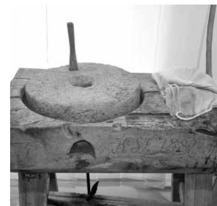
Kézi malom 1882-es évszámmal (Abaúj vm.)

Szekerekkel behordták a ház udvarán álló csűrbe. A cséplés következett: cséphadaróval verték ki a kalászból a búzaszemeket. Egyszerre ketten, négyen is dolgoztak. A rozs szárára vigyáztak, mert a cséplés után megmaradt szalmát zsúpba kötötték, és tetőfedésre használták.