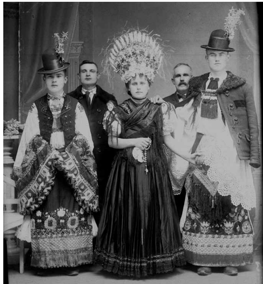
Matyó menyasszony, vőlegény, vőfély és az esküvői tanúk (Mezőkövesd, 1920-as évek)

Az országosan jellemző tendenciákkal együtt a helyi viseletekben is egyre erősebb egyéni vonások jelentkeznek ebben az időszakban. Sokfelé megfigyelhető egy erőteljesen paraszti ízlésű, helyi öltözködési stílus kialakulása. Különösen a nők ruházata tükrözte kifejezően viselője életkorát, családi állapotát az adott közösségben elfoglalt társadalmi rangját-elismertségét, a megjelenés alkalmát. A női öltözetben a felsőruházat és a fejviselet számos apró jellegzetessége a