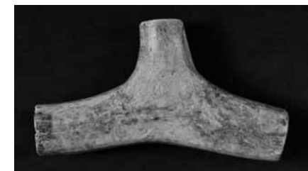
Szarvasagancsból készült avar kori sórtartó (Hídvégárdó)

emelünk ki, ez a tárgy azonban, ha figyelünk rá, mesélni kezd. A lelet megyénk északi részén, a mai Szlovákia határán fekvő Hídvégárdón került elő. Az utóbbi években előkerült avar temetők leletanyaga alapján egyre jobban megismerjük ennek a földművelő, már nem nomád állattartó népnek az életét: a halottak mellé rakott viseleti és használati tárgyak, így a szarvasagancsból készült tégely is az életéről, az élő ember dolgos mindennapjairól beszél. A fémből készült övveretek megőrizték azt a hallatlanul gazdag mintakincset, mely az avar díszítőművészet jellemzője volt, és az agyagedények bekarcolt mintái is arra utalnak, hogy az emberek ebben a korban is szerették maguk körül a szépet. Egészen biztos, hogy voltak színes nemeztakaróik, szőnyegek, és a ruháikat is rátétekkel, hímzésekkel díszítették, gondoljunk csak a pásztorok által még nem oly régen viselt subákra.