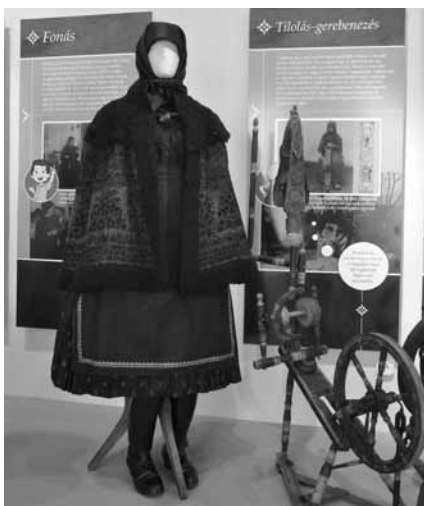
Dél-borsodi idős asszony téli ünnepi öltözete, kunsági kisbundával