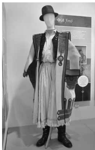
Matyó férfi cifraszűrben, vászongatyában és vászoningben