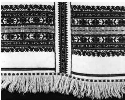
Szedettes szőttes díszlepedő, 1910-es évek (Tard, Borsod vm.)

A hímzés a magyar népművészet egyik leggazdagabb területe. A fonalat túvel viszik fel az alapanyagra, így alakítják ki a mintát. A népi hímzésekben a négy alap öltésfajta (laposöltés, huroköltés, láncöltés, keresztöltés) számos változatát használják. Régiesebb, ősbibb technika a keresztzemes hímzés, ahol az apró keresztöltések mértanivá teszik a mintát. Újabbak az íves vonalak mentén haladó, térkitöltő színes hímzések. Ezeknél a tehetséges kezű, jól rajzoló íróasszonyok előre megrajzolják a mintát.