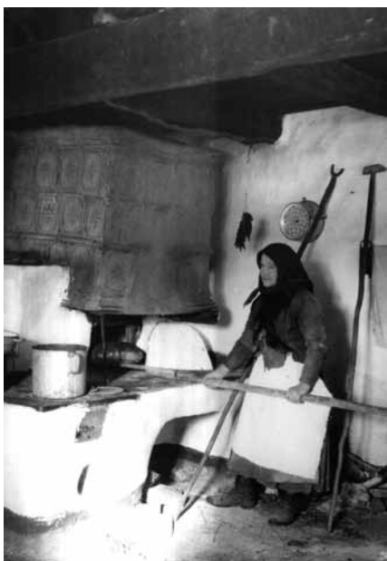
Kenyérsütés kabolás kemencében (Zemplén vm.)

és szakajtókendővel letakarva érni hagyta. Közben befűtötte a kemencét, majd hajnali öt óra tájban bevetette a kenyereket. A reggeli harangszóra megsült, kihűlés után a helyére került a mindennapi kenyér.