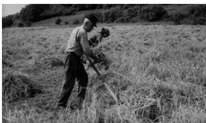
Idős aratópár: kaszás és marokszedő (Putnok, Gömör vm.)

A közmondás szerint Szent János napján (június 24.) szakad meg a búza töve , vagyis már nem növekszik tovább. Az aratás kezdete a hagyomány szerint Péter-Pál napja (június 29.) volt. Ha beérett a gabona, a munka nem tűrt halasztást. Heteken át, hajnaltól késő estig, alig