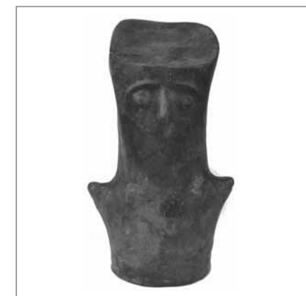
Ember alakú arcós urna (Ózd-Center)

A Herman Ottó Múzeum Régészeti Gyűjteménye rendkívül gazdag művészi színvonalon megformált műtárgyakban. A sok titkot rejtő raktárak mélyén olyan csodákkal is találkozhatunk, amelyekről a régmúlt idők emberarcai tekintenek ránk. Ezek egyike az az urna, amely egyetlen kiállításunkról sem hiányozhat egyedisége, ritkasága okán. Bemutatásával megpróbáljuk közelebb hozni a látogatókhoz ezt a páratlan alkotást és korát.