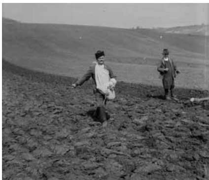
Kézi vetés (Bánhorvát, Borsod vm.)

Az aratás végeztével a nagy gazdaságokban, uradalmakban felvonulások aratóünnepet tartottak. Búzakarászokból, szalmából, virágokból aratókoszorút és szalmadíszeket fontak, a szerszámokat kifestve, felpántlikázva vitték magukkal. A menet a gazda vagy az uraság házánál megállt. A köszöntőversek, hálaadó imádságok után átadták az aratókoszorút, és hajnalig tartó zenés táncmultság következett.