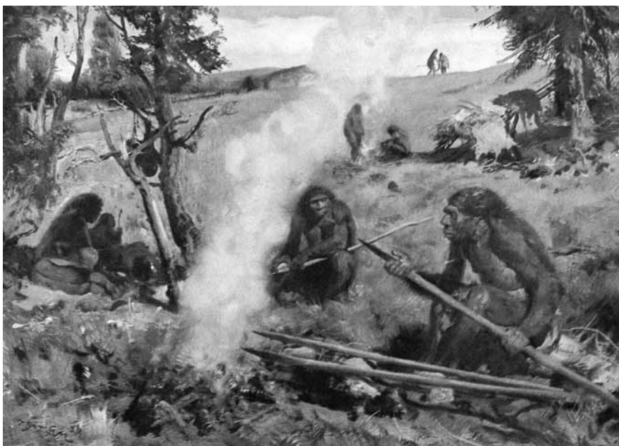
Neandervölgyiek tűzben edzik fa lándzsáikat (Zdeněk Burian: „Lándzsák” című festménye nyomán)

A szeletai levéleszközök a Miskolc-Felsőhámor fölött található Szeleta-barlangról kapták nevüket, ahonnan elsőként kerültek elő példányaik. Nyersanyaguk jellemzően a bükk-szentlászlói üveges kvarcporfir. A kor és a régészeti kultúra szempontjából korai és fejlett szeletai levéleszközöket különböztetünk meg. A forma és a funkció alapján beszélhetünk levélhegyekről és levélkaparókról. Míg előbbieket lándzsacsúcsok, tehát fegyverek voltak, utóbbiak inkább a bőr, esetleg a csont és a fa megmunkálásához gyártott eszközök.