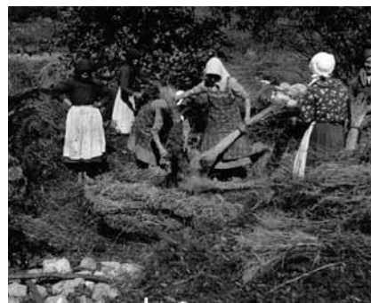
Kenderkékék kiszedése az áztató gödörből (Mályinka, Borsod vm.)

Virágos kenderem elázott a tóba, Ha nem szeretsz rózsám, ne jöjj a fonóba! Mert elejted orsód, s nem lesz, ki feladja, Bánatos szívedet ki megvigasztalja.