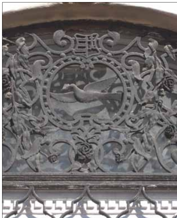
10. kép. Postagalamb.