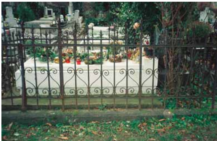
22. kép. Barokkos sírrács a mindszenti temetőben.