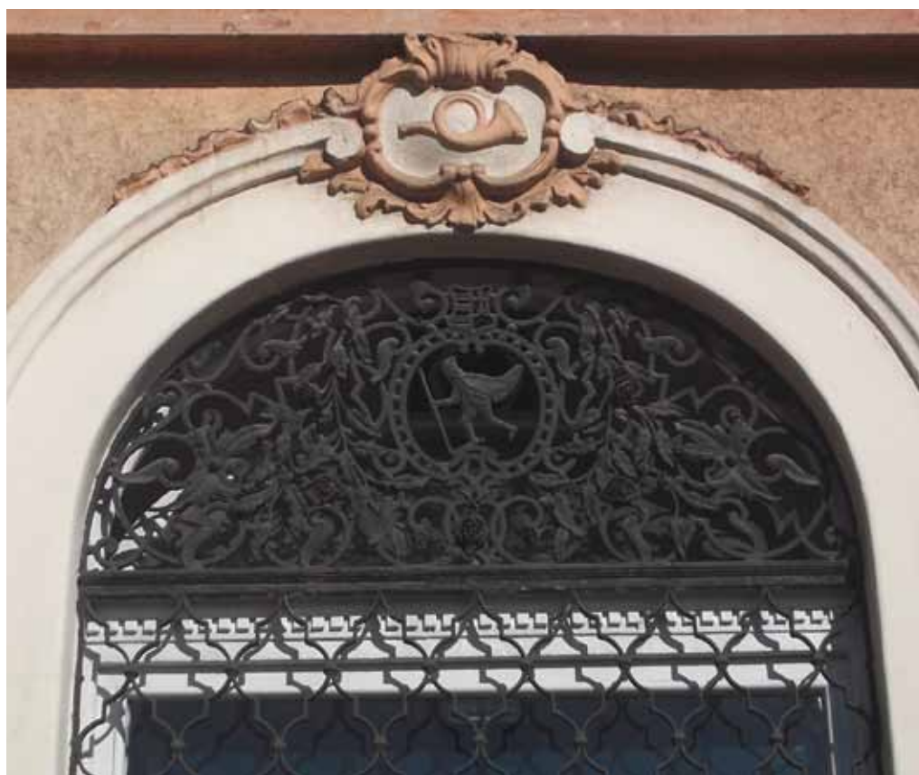
8. kép. Egyedi mintájú lünetták az ablakok és ajtók felső részén.