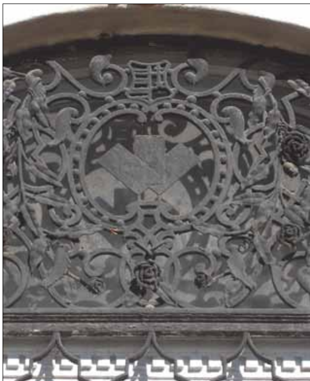
11. kép. Postai levelek.