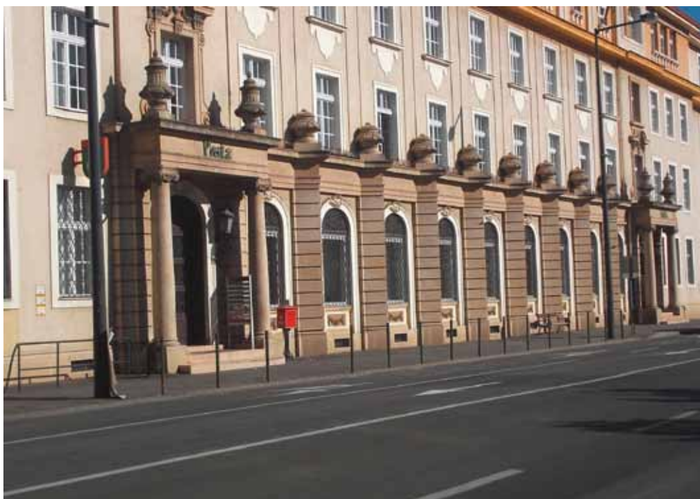
5. kép. A Postapalota homlokzata északi irányból.

volt: kinyitotta 1950 nyarán a miskolci Minorita templom kovácsoltvas műemlék ajtajának főzárát úgy, hogy az továbbra is üzemképes maradt. Számos típusú páncélkasszát is ki tudott nyitni zárlakatosi képzettségével.