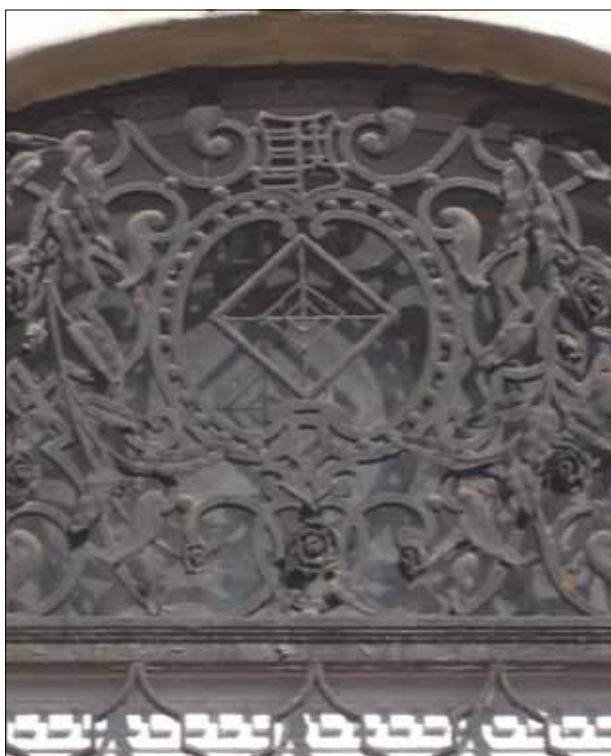
17. kép. Keretes rádióantenna.