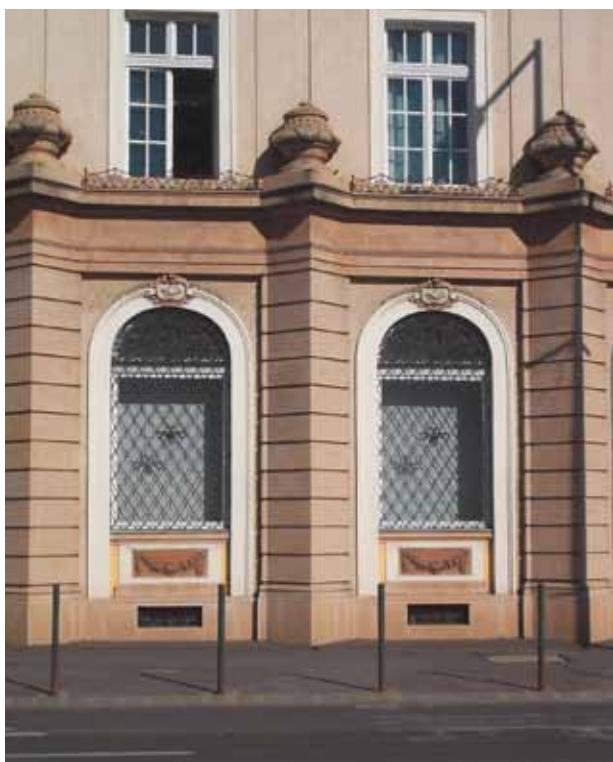
6. kép. Az ablakok barokkos rácsozata és a homlokzati díszítőelemek.