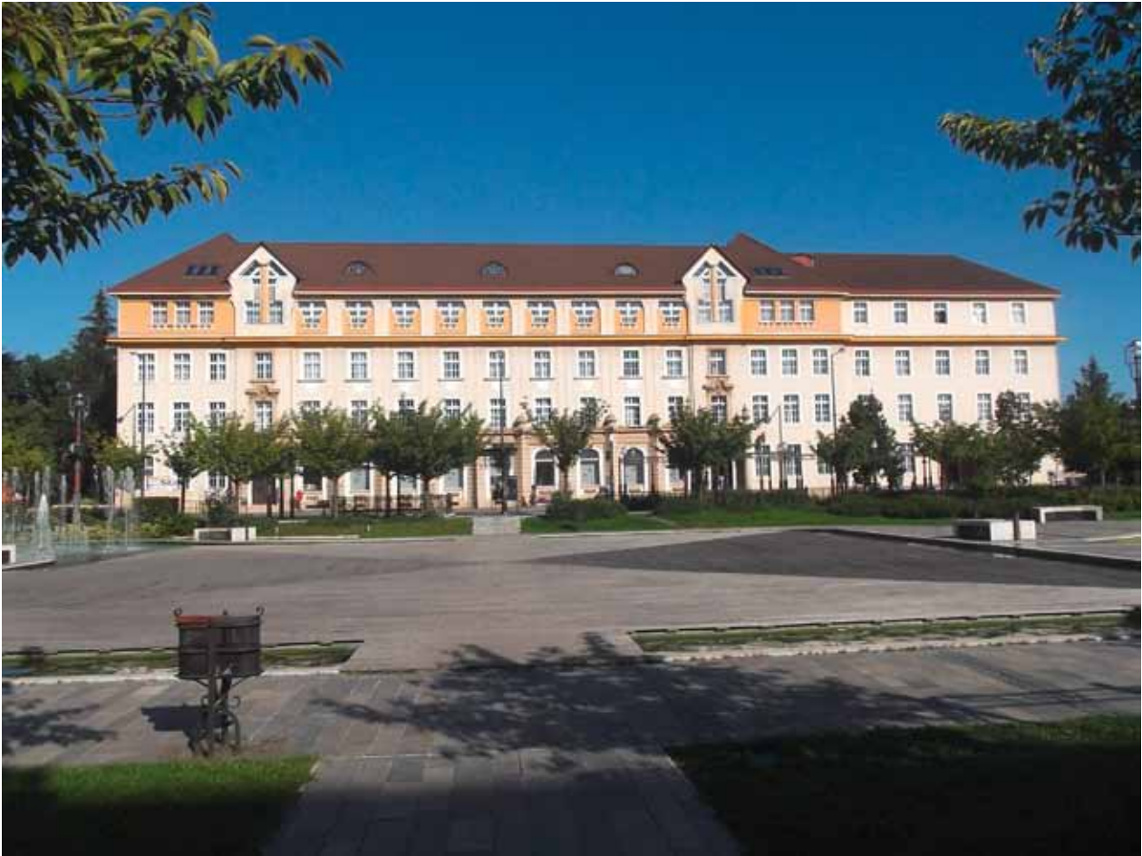
1. kép. A miskolci Postapalota 2016-ban. Az eredetileg szimmetrikus homlokzatú épületen jól látható a déli szárny bővítése (1950-es évek), és a későbbi emeletráépítés (1990-es évek).

is tervezett: urnák, füzérek, ablakpárkányok, mellvéd kötények tagolják a homlokzatot (KAMODY 1990, 128–129). Így valószínű, hogy az ablakok és ajtók-kapuk rácsozatát, illetve az ablakok felső tagozataiban a félköríves lünetták egyedi kovácsoltvas motívumait is ő tervezhette, a Sznagyik–Székely díszkovács mesterpáros az ő terveit valósította meg.