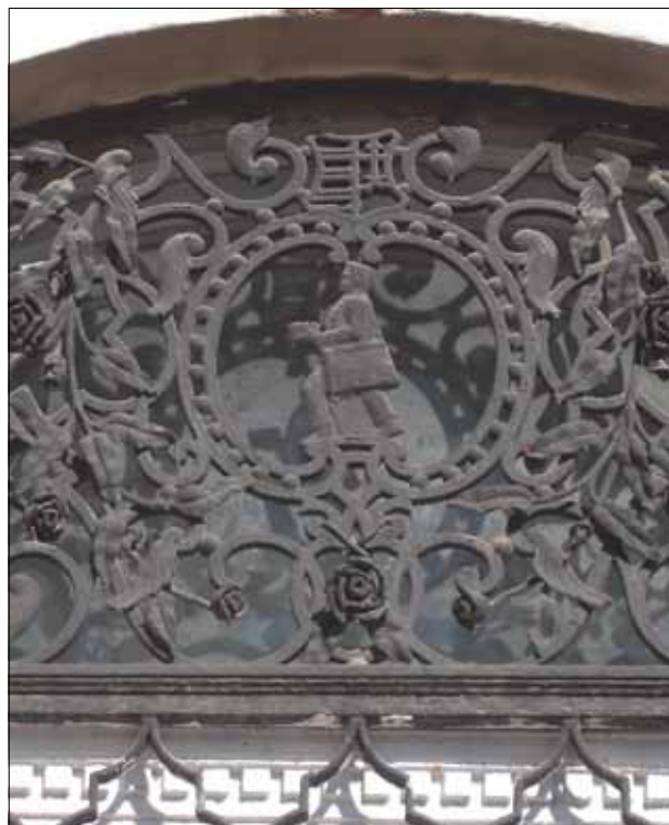
12. kép. Postás, gyalogos kézbesítő.