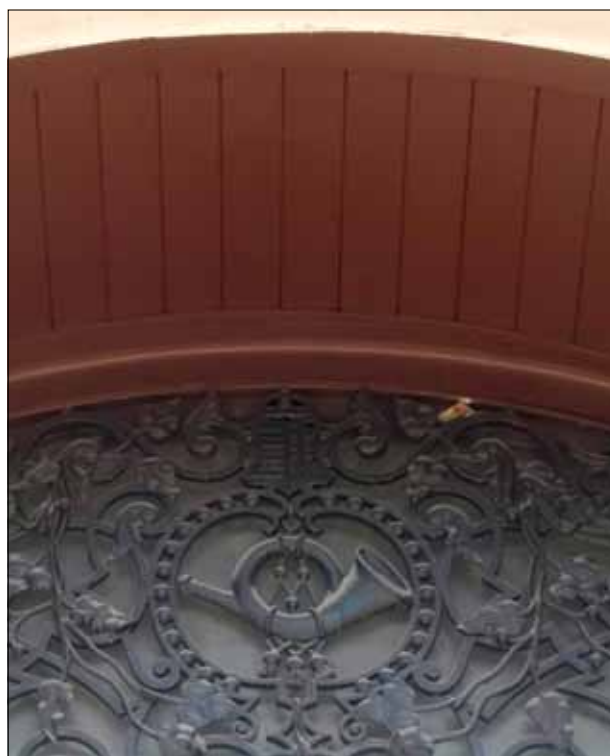
18. kép. Az északi és déli kapu fölötti postakürt.