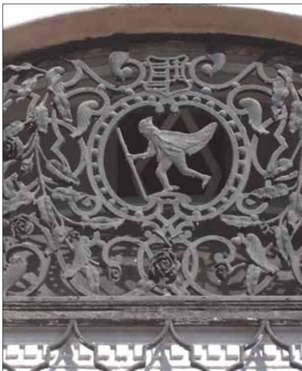
9. kép. Hírívő gyalogfutár.