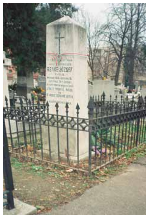
23. kép. Klasszicizáló sírrács a mindszenti temetőben.