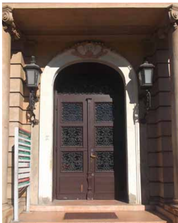
7. kép. Az északi és a déli kapu rácsozata.