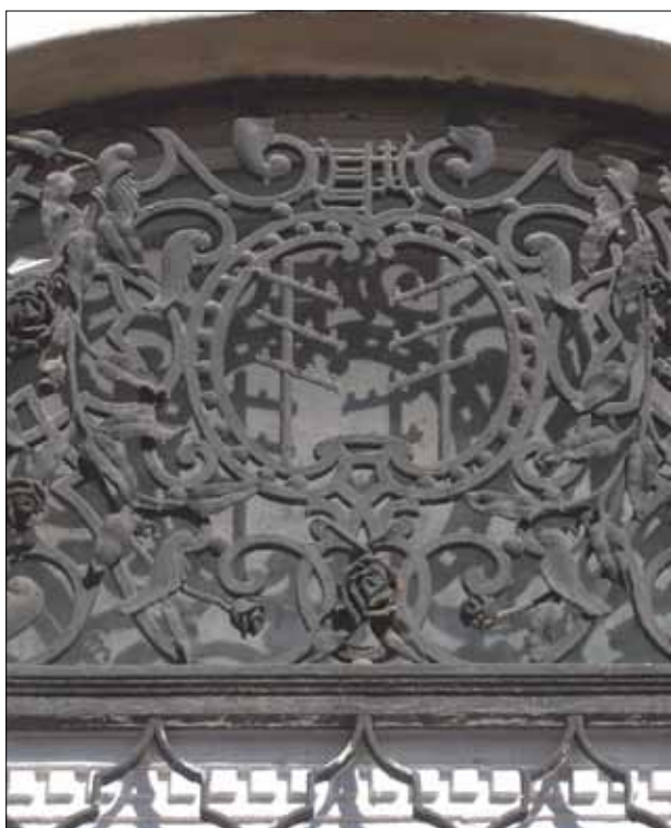
13. kép. Táviró oszlopok.