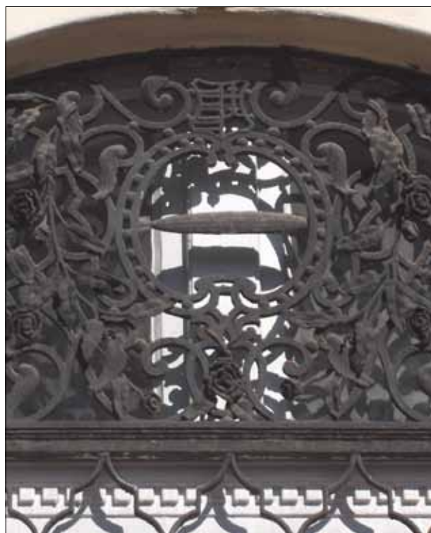
16. kép. Zeppelin léghajó, légiposta.