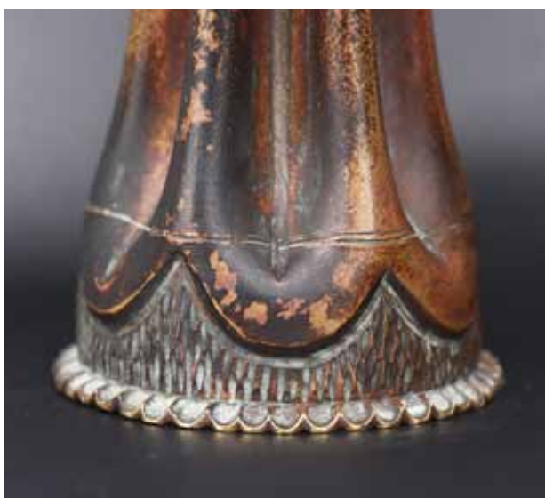
28. kép. Az 1942-ben készült váza részlete.