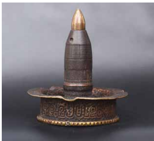
29. kép. Hamutartó. Az alsórész anyaga sárgaréz. A felsőrész egy robbanólövedék, anyaga acél, a hegye eredetileg sárgaréz, e példányon vörösréz pótlás. Felirata: Orosz földről 1942. júl. 28. Készítette Sznagyik Sándor.