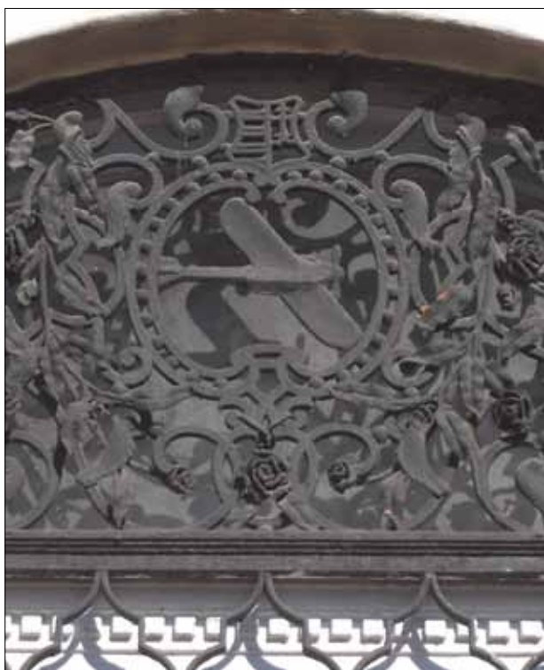
15. kép. Postai repülőgép, légiposta.