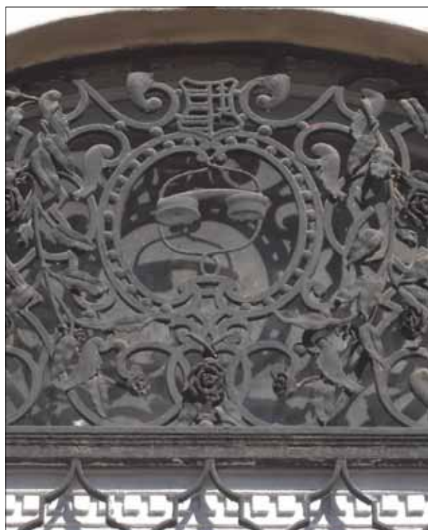
14. kép. Telefon.