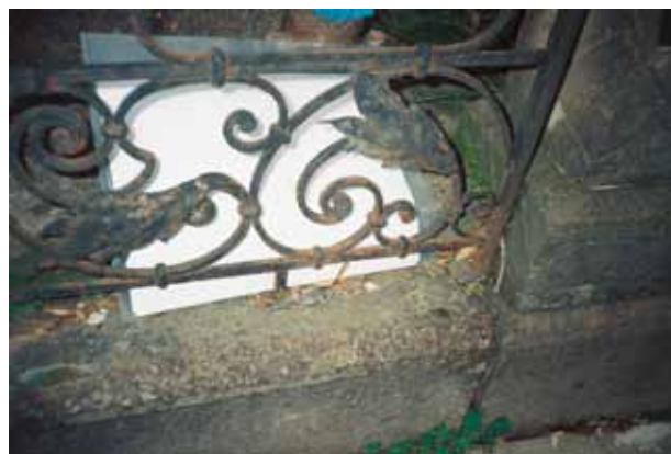
20–21. kép. A Sznagyik-sírhely a Miskolc-mindszenti temetőben, a mesterpáros által készített barokkos sírráccsal.