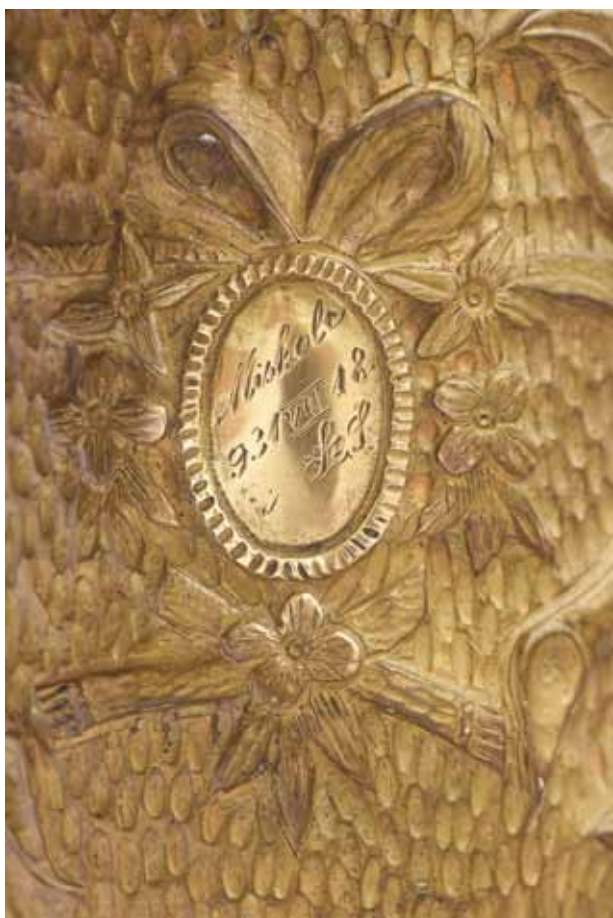
26. kép. Az 1931-ben készült váza részlete, a mester kézjegyével.