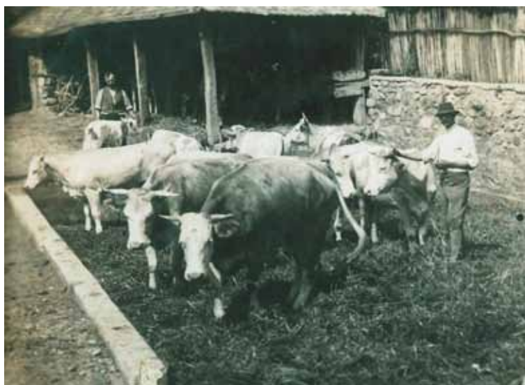
14. kép. Trágyataposztás a Klema-portán, 1940-es évek.

A lapokban a legtöbbet a csűrőről olvashatunk, amelybe hordták a morvát, a búzát, az árpát, ezek szalmáját. 1941. nyarán írta Gyula gazda, hogy „legalább némileg biztosítani kell a feldőléstől”,