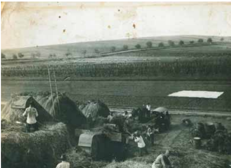
12. kép. Gépi cséplés Garadnán.