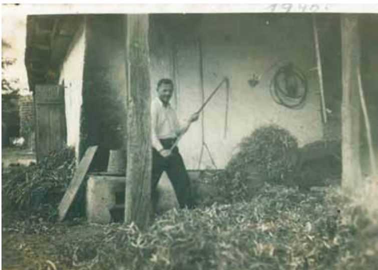
13. kép. Kézi cséplés Garadnán, 1940. (A fénykép magántulajdonban.)