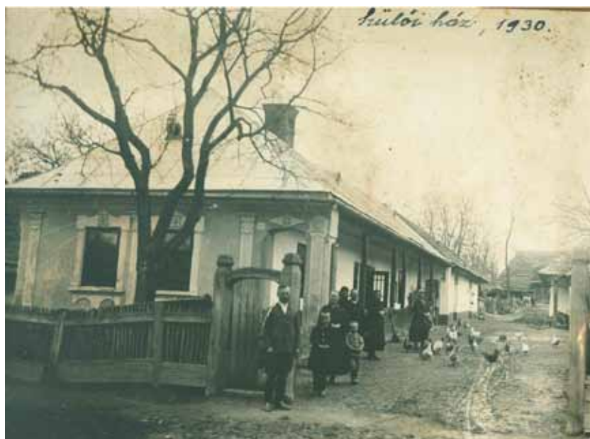
1. kép. Garadna, „Szug” falurész. A Klema család háza és portája az 1930-as években.