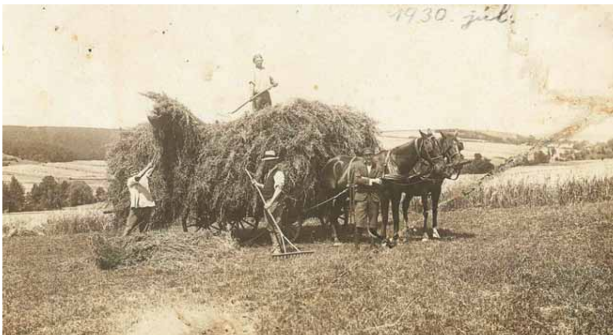
11. kép. Gyűjtés, hordás szekérral. Garadna, 1930. július.