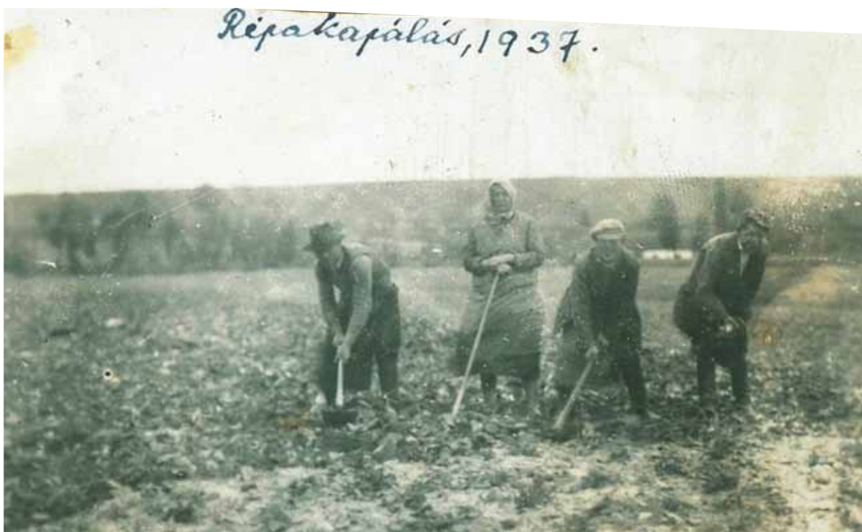
16. kép. Répakapálás Garadnán, 1937.

etessétek”. 170 Egy év múlva azt tanácsolta, hogy az „ásását még nem kell megkezdeni, lehet úgy október 10-ig a földben”. 171 Novajidrányban október másodikán már elkezdték az ásást, a Klema családnál november közepén pedig még mindig folyt a cukorrépa ásása, és ekkor meg is kezdték a szállítását. 1941-ben Gyula gazda a cukorrépa termésel nem volt megelégedve, „elég gyenge hozamot adott”. 172