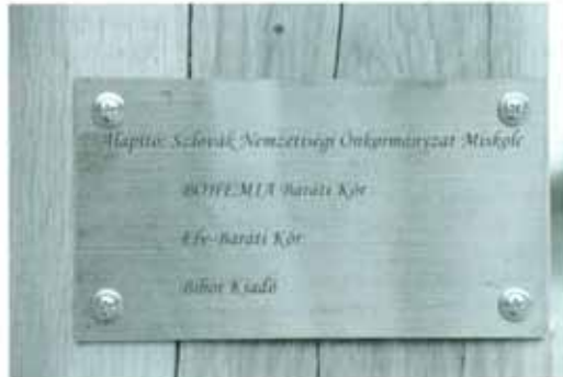
Az emlékoszlop alapítóinak táblája

„A kohászat ősidőktől működött, annak ellenére, hogy a térségben vélhetően nincs vasérclelőhely. De mégis valahol sor került annak kitermelésére, ahogyan ezt a Stará Huta megnevezés jelzi. Ezt támasztja alá, hogy Diósgyőr térségében ma is bányászokdásról lehet beszélni. Az is lehetséges, hogy a jelenlegi lakosok az itt maradt husziták