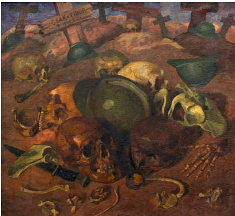
6. kép. Sassy Attila: Ezt akarjátok? című festménye, 1951. (HOM KGY Lsz: 63.77.)

Fig. 6. Attila Sassy's painting, "Ezt akarjátok?" ("Is this what you want?"), 1951. (Herman Ottó Museum, Fine Arts Collection. Inv. no: 63.77.)