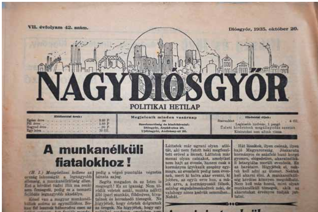
1. kép. Az egyesületi életet bemutató lap (1931–1936).