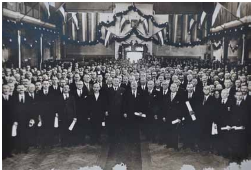
6. kép. A vasgyári munkás étterem rendezvényre feldíszítve.

Az egyesületi alapszabályokat a Magyar Királyi Belügyminiszter 1923. június 26-án, a 103.326-1923. VIII. számú határozatával fogadta el és hagyta jóvá. 1 Az egyesület tevékenységére utaló első bejegyzés 1923. október 3-i keltezéssel a Diósgyőr-vasgyári Kultúrbizottság jegyzőkönyvében található, melyben a Turán Egyesület bejelentette működésének megkezdését és egyúttal kérte a Kultúrbizottság támogatását (beleértve természetesen