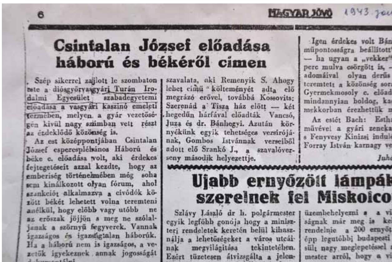
11. kép. Korabeli sajtótudósítás egy Turán egyesületi szabadegyetemi előadásról.