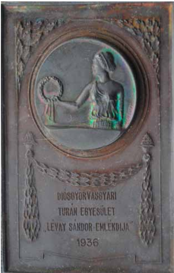
8. kép. Bronzplakett, mint irodalmi pályázati díj.