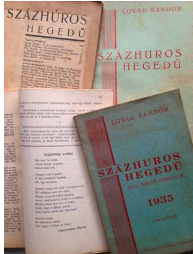
9. kép. Százhusros Hegedű – budapesti antológia, több vasgyári költő versével.