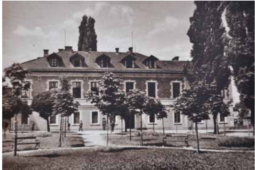
4. kép. A Vasgyári Kaszinó – több egyesület székhelye.