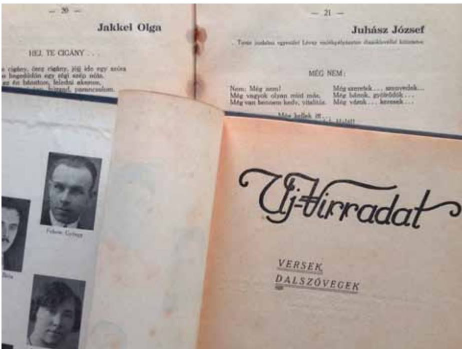
10. kép. Új Virradat – kaposvári antológia, vasgyári költők verseivel.