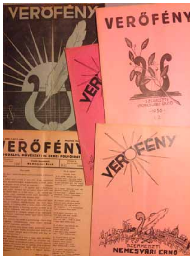
7. kép. A Verőfény című kispesti folyóirat, 1937-től a Turán Egyesület hivatalos lapja.