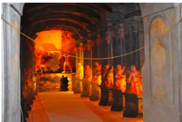
10. kép. Szentsír, Szepesszombat (ma: Spišská Sobota, Szlovákia).