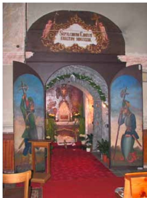
9. kép. Szentsír, Rudnok (ma: Rudník, Szlovákia).