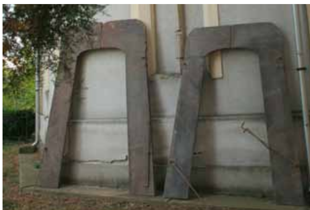
3. kép. A szentsír második és harmadik kapuja. Boldogkőváralja, 2011.

Fig. 2. The back plate, closing the sepulchre. Boldogkőváralja, 2011.