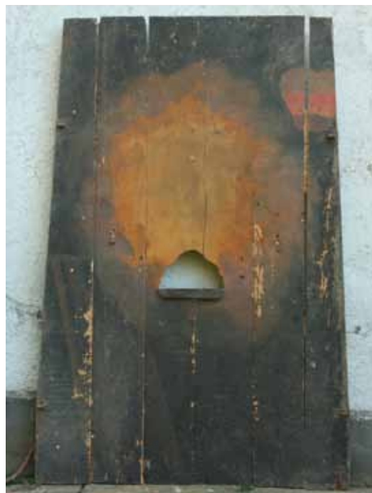
2. kép. A szentsírt lezáró hátfal. Boldogkőváralja, 2011.

Fig. 1. The first gate of the sepulchre with the two angels. Boldogkőváralja, 2011.