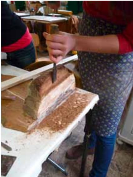
14. kép. Az angyal roncsolódott részeinek eltávolítása.