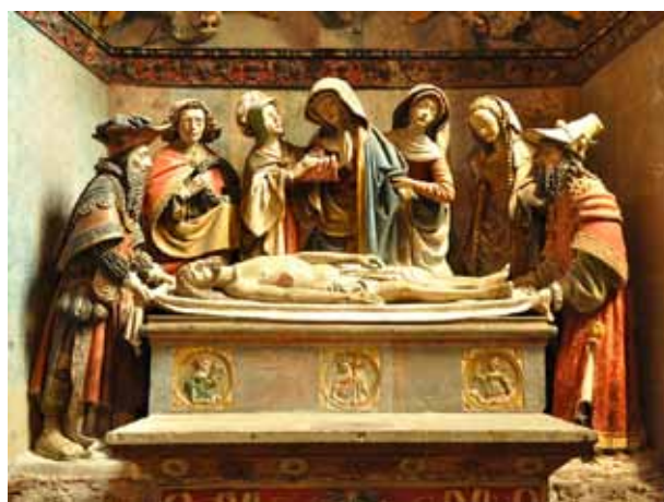
5. kép. Szentsír, Notre Dame, Rodez, Franciaország (1523)