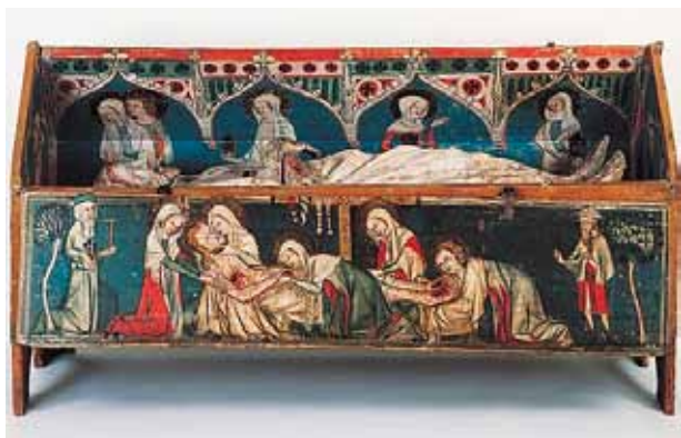
6. kép. Szentsír, Maigrange apátság, Fribourg, Svájc