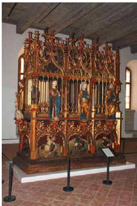
7. kép: Úrkoporsó, Chemnitz, Németország.