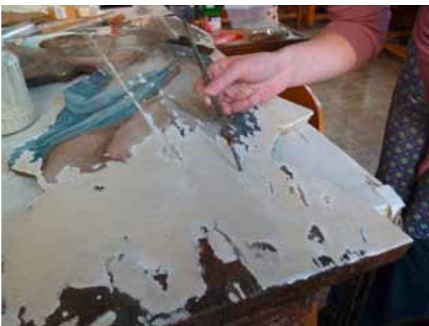
15. kép. Az angyal sérült részeinek alapozása. Fig. 15. Underpainting the damaged parts of the angel.