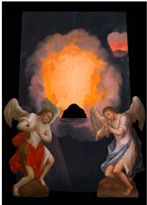
17. kép. A hátfal és az angyalok kész állapota. Fig. 17. The restored back plate and angels.