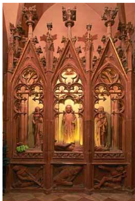
4. kép. Szentsír, St. Nicolas templom, Haguenau, Franciaország (14. sz.)

A 18. században lezárult a Dicsőség Színházának fénykora: az 1730-as, '40-es éveket követően a pompás díszletek elmaradtak, a szertartás látványossága megszűnt. Napjainkban német nyelvterületen újra előkerültek ezek a gazdagon díszített építmények, felújították vagy restaurálták őket és húsvét alkalmával a templomok legnagyobb látványosságává váltak (KNAPP–KILIÁN 1999, 106–146). A magyarországi emlékművek igen csekély, épségben megmaradt darab szinte alig akad. Legfontosabb a garamszentbenedeki Úrkoporsó, amely középkori művészetünk kincse, európai viszonylatban is jelentős értékeket képvisel, kerek megoldása következtében pedig egyedülálló (PROKOPP 1982).