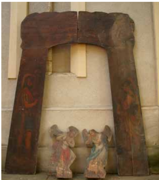
1. kép. A szentsír első kapuja a két angyallal. Boldogkőváralja, 2011.

Fig. 1. The first gate of the sepulchre with the two angels. Boldogkőváralja, 2011.