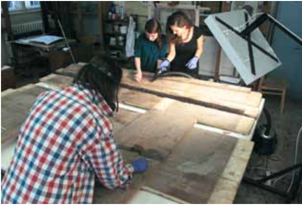
13. kép. A hátfal fafelületének tisztítása. Fig. 13. Cleaning of the wooden surface of the back plate.