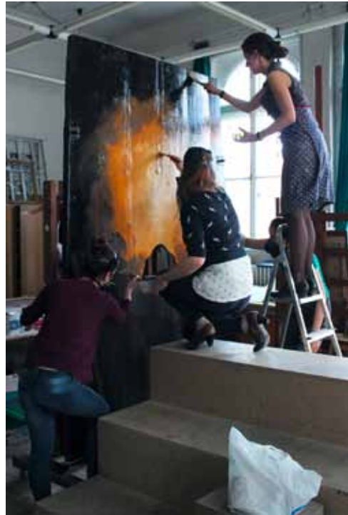
16. kép. A hátfal lakkozása. Fig. 16. Enameling of the back plate.