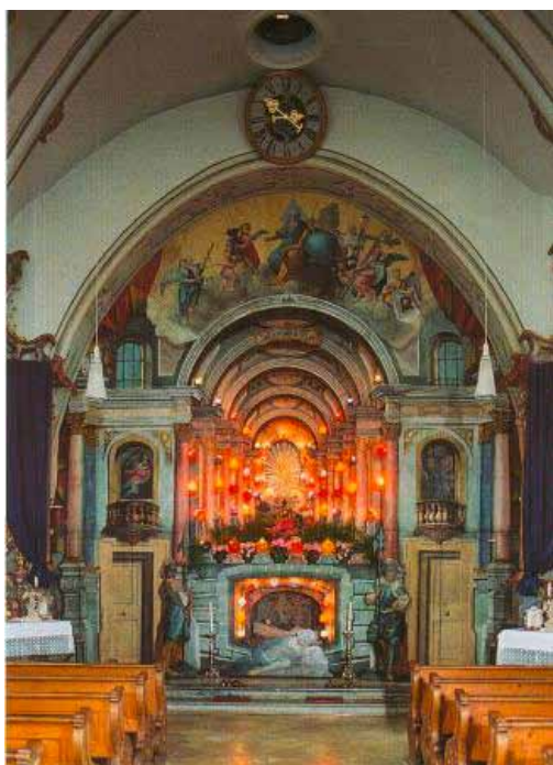
8. kép. Szentsír, Szent Mihály templom Gaißach, Németország. (1711)