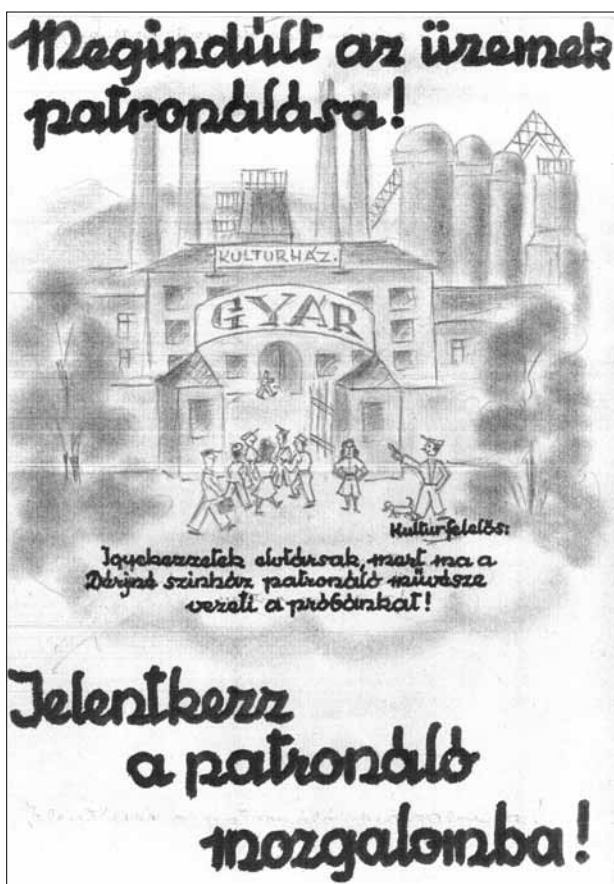
5. kép. Fekete Alajos színművész rajza a patronáló mozgalomról. (HOM SZGY)