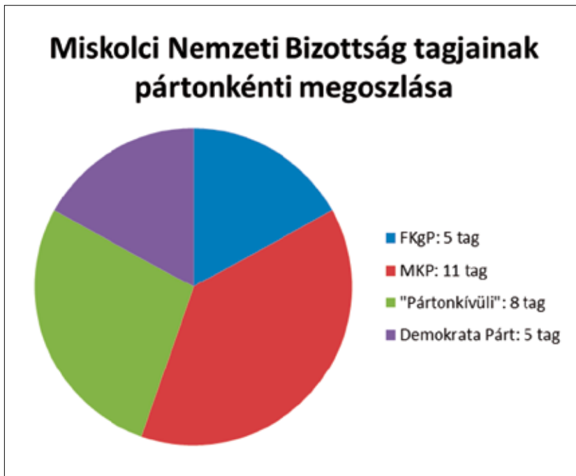
1. kép. A Miskolci Nemzeti Bizottság tagjainak pártonkénti megoszlása, 1944. december

Fig. 1. Distribution of the National Committee of Miskolc by political parties, December 1944.