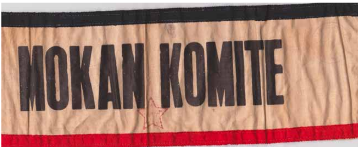
2. kép. A MOKAN-Komité karszalagja, 1944. (Magángyűjtemény) Fig. 2. The armband of the MOKAN-Committee, 1944. (Private collection)

tartottak házkutatásokat (hiszen bejelentések alapján csak feltételezhatték, hogy az adott személy bármilyen „felesleges” ingósággal rendelkezett) és lefoglalásokat. „A felszabadulási időszakban hosszú időn keresztül a MOKAN volt az egyetlen szervezet, amely a közellátást szervezte és a rendőrség szerepét is betöltötte a kommunisták vezetésével. Ezt az időszakot diktatórikus rendelkezéseink jellemezték és ezt minden központi direktíva nélkül csináltuk a termelés és közellátás érdekében.” 44