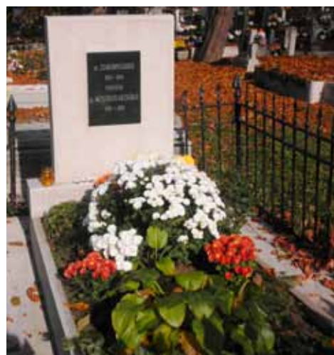
3. kép. Sírja a miskolci Mindszenti Evangélikus temetőben. Fig. 3. His tomb in the Lutheran cemetery at Mindszent.

E sorok is jeles bizonyítékai Zsadányi Guidó szakmai tevékenységének, tudásának; bibliográfiája pedig miskolci/múzeumi munkásságának széles spektrumát tárják a közönség elé.