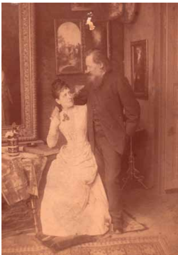
1. kép. Herman Ottó feleségével, Wartha Vince felvétele, 1885 körül. (HOM Ltsz. 70.48.15)

Fig. 1. Ottó Herman with his wife. (Photo by Vince Wartha, around 1885, HOM, Ltsz. 70.48.15)