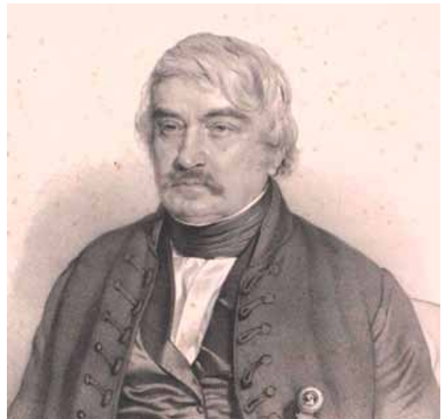
24–25. kép. Palóczy László Rohn Alajos (1861) és Franz Eybl (1843) litográfiáján, részletek

Fig. 24–25. A. Rohn and F. Eybl: Portraits of L. Palóczy (1861/1843). Lithographs, details