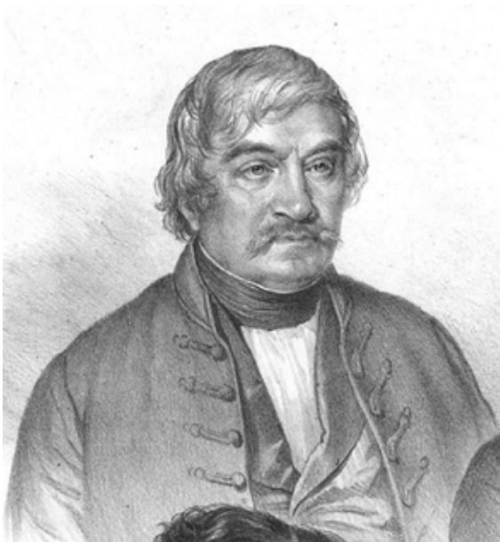
Fig. 23. A tableau of parliamentary orators, 1861. Lithography