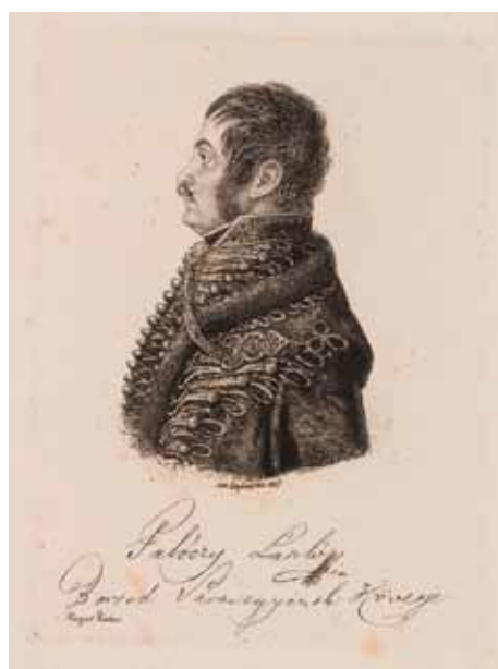
2–3. kép. F. Lütgendorf: Ragályi Ábrahám tornai és Palóczy László borsodi követ arcképe, rézkarc, (részletek) 1827. (ELTE EK és HOM HTD)

Fig. 2–3. F. Lütgendorf: MP A. Ragályi and MP L. Palóczy, 1827. Etchings