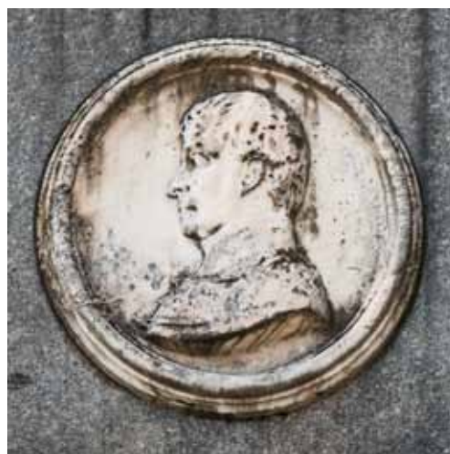
29. kép. Vay Miklós: Palóczy László, relief a Palóczy-síremléken, 1868.

Fig. 28. Honorary monument of L. Palóczy (Vasárnapi Ujság, 31 Oct. 1869)