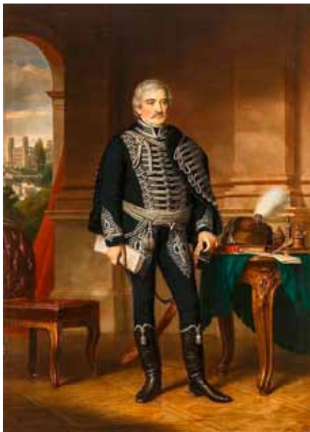
27. kép. Barabás Miklós: Palóczy László képmása, 1868. (HOM KGY)

Fig. 27. M. Barabás: Portrait of L. Palóczy, 1868. Oil on canvas.