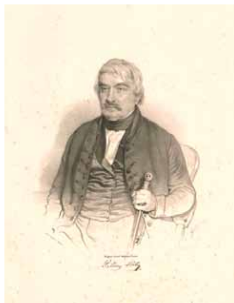
6–7. kép. F. Herr (1840) és F. Eybl (1843) portréja Palóczy Lászlóról, litográfiák részlete. (ELTE EK és MTKCs)

Fig. 6–7. F. Herr and F. Eybl: Portraits of MP L. Palóczy, 1840/1843. Lithographs