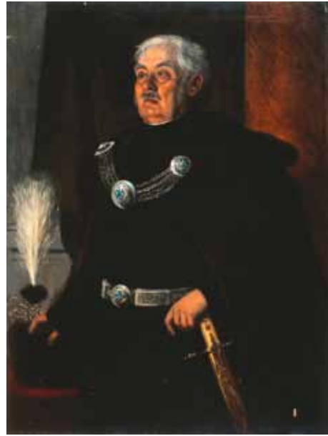
12–13. kép. Grimm Rezső: Palóczy László, 1861. (MTKCs és HOM KGY) Fig. 12–13. R. Grimm: Portraits of L. Palóczy, 1861. Oil on canvas.

csagtollas süveget, míg az országgyűlési egészalakos képen zsinóros mentekötője és öve van; a háromnegyedes portré a főúri „díszmagyar” ékszer-készletét hordja, ötvösművű ezüst övet és bogláros mentekötőt. Mintha a kisebb portré megrendelőinek nem lett volna elég előkelő és ünnepélyes Palóczy fekete díszöltözete (amely valószínűleg az eredeti viseletet dokumentálja), az egyszerű kiegészítőket a mágnásviselet tartozékaival cseréltették ki. A viselet kócsagtollas kalpagját valóban hordta Palóczy díszruhája kiegészítőjeként, amikor halála után a gyászvonat megérkezett Pestről Miskolcra, ez képviselte, koporsójára helyezve, halott tulajdonosát. 28 Grimm két festményén csak a díszkard azonos, úgy tűnik, ez olyan emblematikus darab, attribútum volt, amelyen nem lehetett változtatni. A „kistestvér” megrendelője 1861-ben a helyi színház emeletén székelő, 1827-ben alapított miskolci Nemzeti Kaszinó volt, Palóczy halálának évében rendelhették meg, majd a portré a kaszinó letétjeként került a Borsod-Miskolci Múzeumba 1930-ban (PIRINT 2014, 348. 41. jegyzet). Úgy tűnik a Nemzeti Kaszinó, amelyet „úrának” is neveztek, vagyis a mindenkori (nemesi) elit gyűjtőhelye volt Miskolcon és körzetében – hiszen a helyi kereskedők, polgári elemek 1837-től a Miskolci Polgár Egyletbe tömörültek