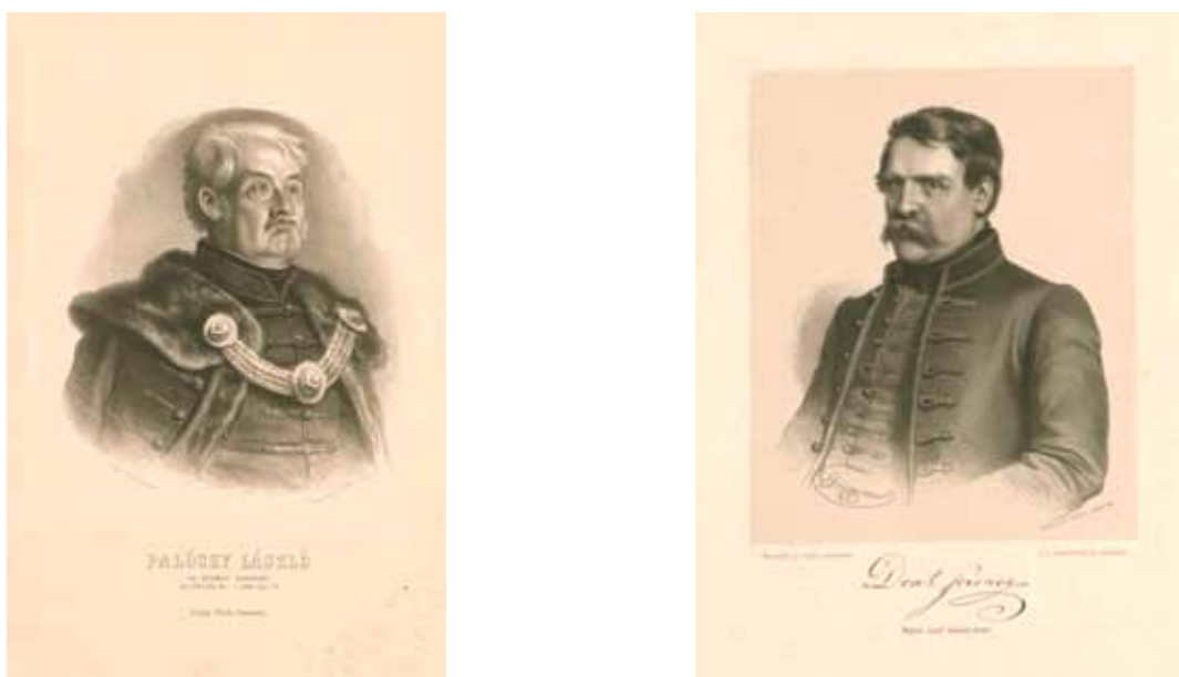
14–15. kép. Grimm Rezső litográfiája Palóczy Lászlóról és Deák Ferencről, 1861. (ELTE EK, MNL ZML) Fig. 14–15. R. Grimm: Portraits of L. Palóczy and F. Deák, 1861. Lithographs