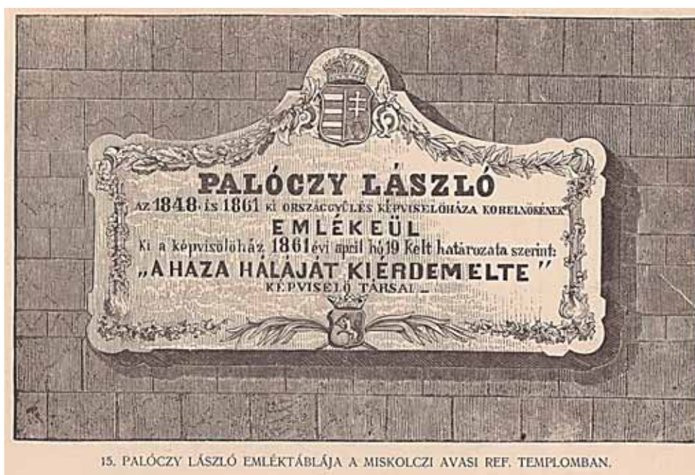
26. kép. Palóczy emléktáblája a miskolci Avasi ref. templomban, 1864 (SZENDREI 1886–1911. IV. 245. alapján)

Fig. 26. Memorial plate of L. Palóczy in Avas Reformed Church, Miskolc, 1864