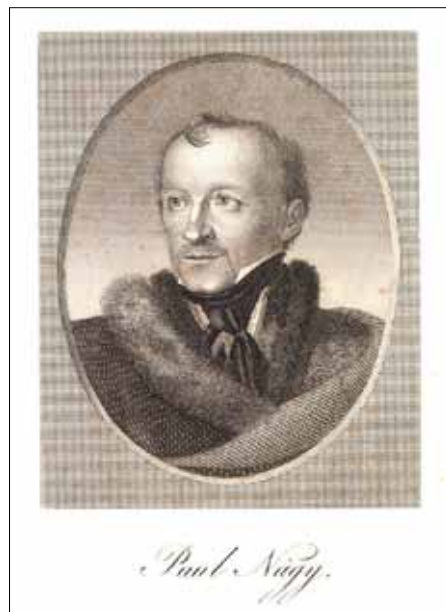
4–5. kép. F. J. Sürch: Ragályi Tamás és (felsőbüki) Nagy Pál, rézkarc, 1831.

(Taschenbuch für die vaterländische Geschichte 1831. 128/129.; 336/337. alapján)