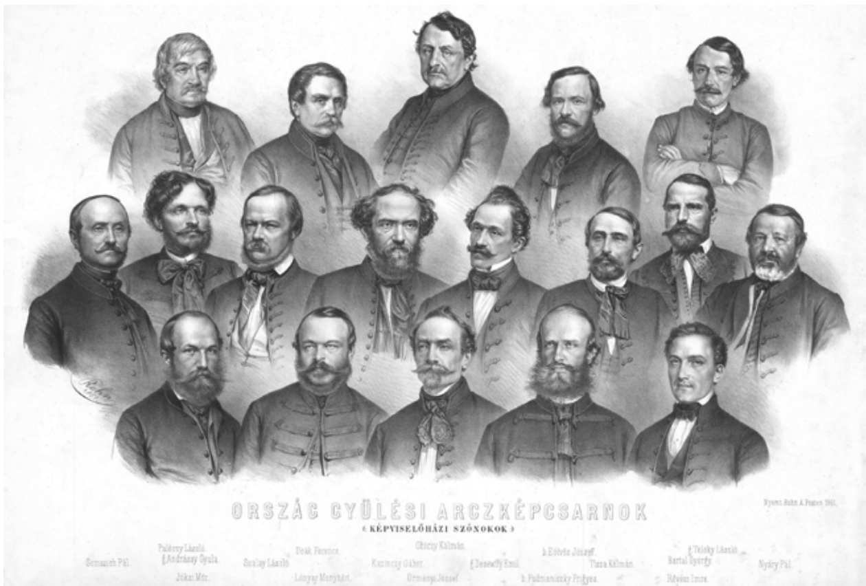
23. kép. Csoportkép az 1861. évi országgyűlés szónokainak emlékére, 1861. (ELTE EK)

Fig. 23. A tableau of parliamentary orators, 1861. Lithography