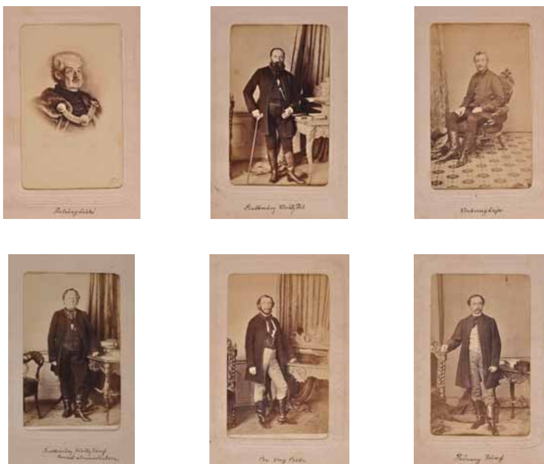
16–21. kép. Borsod vármegye és Miskolc 1861. évi képviselői vizitkártyákon. Fig. 16–21. MPs of Borsod County on visit cards, 1861