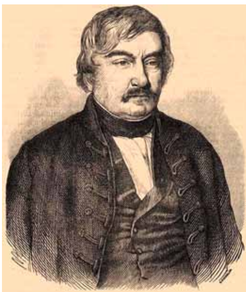
11. kép. Palóczy a Vasárnapi Ujság 1860. okt. 28. számában Fig. 11. Portrait of L. Palóczy in Vasárnapi Ujság, Oct. 28. 1860

viselőház nevében erre felkérte korelnöknek. Palóczy ekkor még nem tudta, de sejtette, hogy közeleg életének vége, erről nyitóbeszéde tanúskodik: