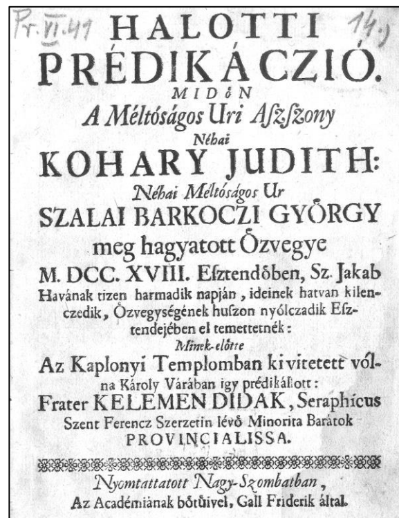
A két nyomtatvány címlapja