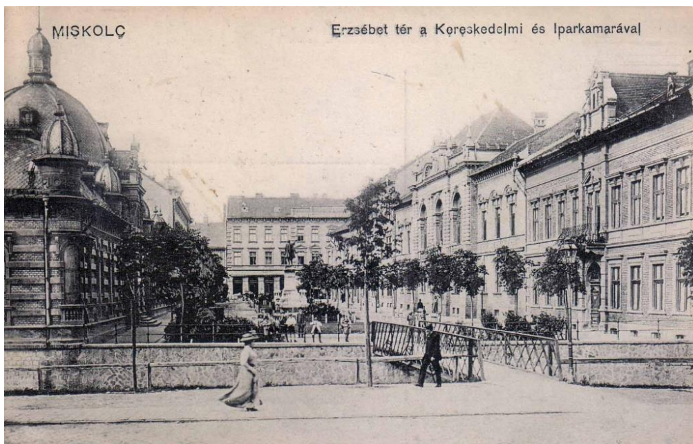
Miskolc 1910 körül, képeslap, magángyűjtemény Miskolc around 1910 on a postcard, private collection

Az 1848. évi áprilisi törvények a földesúri jogokkal felruházott Kassát is megfosztották jobbágyaitól, a gyakorlatban ugyanakkor a jobbágyi világ végső megszüntetéséről csak az osztrák-magyar kiegyezést követően beszélhetünk. A polgári törvényhozás, az 1848. évi XXIII. tc. alapján Kassa szabad királyi város maradt, azaz törvényhatósági joggal felruházott joghatóság, saját törvényhozással és törvénykezéssel, tisztségviselőit maga választhatta. 11