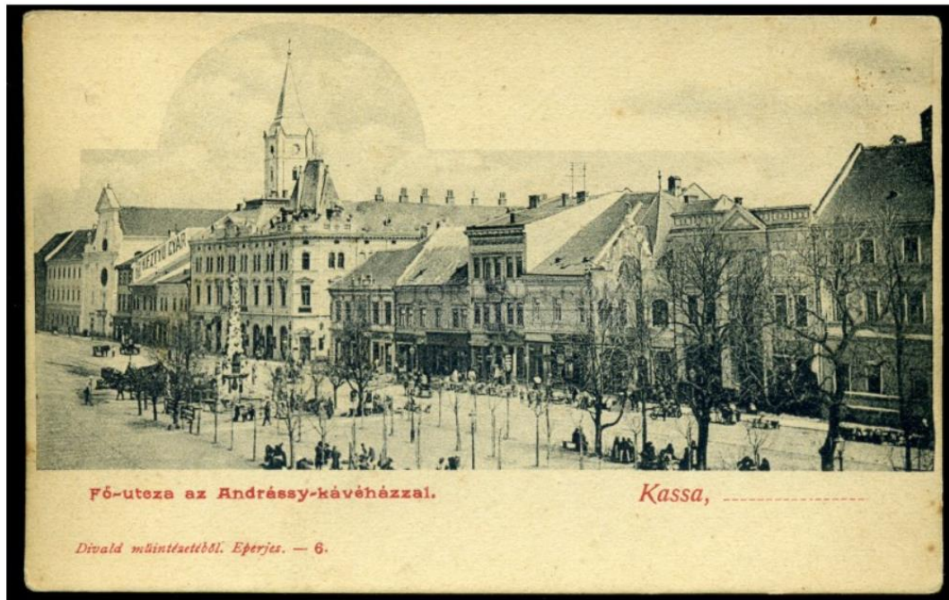
Kassa 1900 körül, képeslap Košice around 1900 as a postcard

Kassán az 1848-as törvényalkotás a közigazgatásban azt eredményezte, hogy a városi tanácsülések ezen túl két bizottságban tárgyalták az ügyeket, mégpedig a polgári-gazdasági tanácsban és a bírói székben. Ezeket az ügyeket már korábban is külön vezették a jegyzőkönyvekben, de először fordul elő, hogy a belső tanács képviselőit kettéválasztották, és a 6-6 ember külön tárgyalta a polgári-gazdasági, valamint a bírósági ügyeket. 13 Kassán a városi tanácsban új hivatal jelent meg, mégpedig a városi honvédelmi bizottság, amely a városi sorozást irányította 1848 novemberétől. A városi honvédelmi bizottság a belső tanács irányítása alatt állott, tehát saját jogkörrel nem rendelkezett.