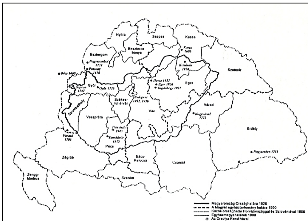
4. Orsolya-rendházak a Magyar Királyságban

Az Orsolya-rend iskolái komoly vallási életre nevelték tanítványaikat, s a korszerű tanítás fontossága mellett sohasem tévesztették szem elől, hogy rendjük szelleme szerint feladatuk hívő, katolikus anyák nevelése. Ezt a célt akarták szolgálni azzal is, hogy 1902-ben megalakították növendékeik részére a Mária-Kongregációt, mely két csoportra oszlott: a III-IV. osztályos polgáristák a kisebbek, a már iskolába nem járók pedig a felnőtt lányok csoportjába kerültek. Jézus Szíve tiszteletében a feladatuk az apostolkodás volt, tehát az Orsolya-nővérek ezzel a kezdeményezéssel is hozzájárultak a város vallási életének fejlődéséhez és a nőneveléshez kiteljesítéséhez. 20