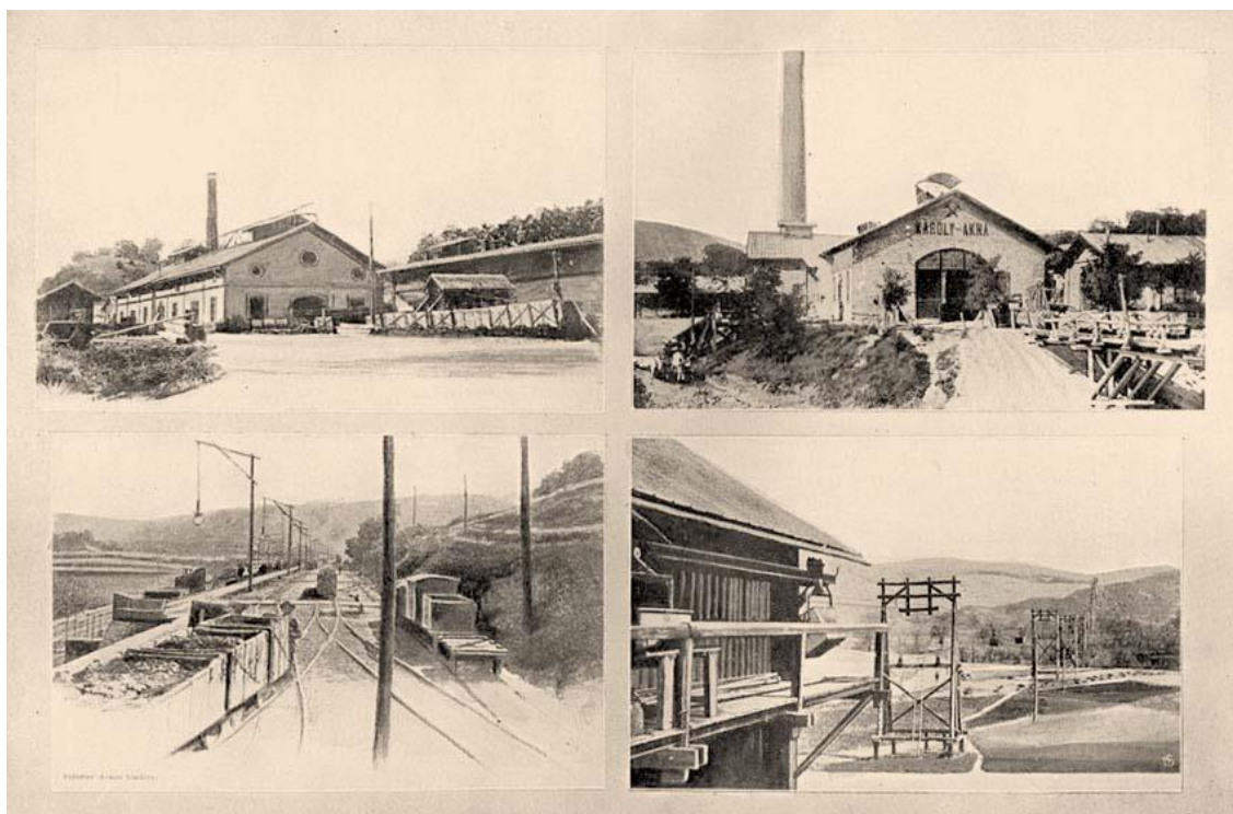
Részletek a salgótarjáni kőszénbánya r. t. bányáiból. BOROVSKY 1911. alapján

Területünkön írásbeli források a 17. század végén említenek először szénelőfordulásokat. Kisebbségi jelentőségű bányászat már a 19. század elején folyt különböző szénkibúváson, amely lelőhelyeken ún. „ bicska-bányák ” működtek. Ez azt jelentette, hogy amikor a fűtéshez télen szükség volt szénre kinyitották, majd tavasszal bezárták.